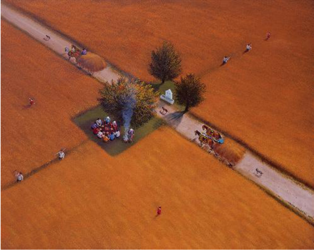
Resim 3. Yalçın Gökçebağ, Tuval üzerine Yağlı boya, 80x100 cm.

Üçüncü eserde, peyzaj (manzara) çalışmasını görmekteyiz. Yine birden fazla figüratif (insan) lar yer almaktadır. Teknik olarak Yağlı boya kullanılmıştır. Toprak unsuru, gerçekçi bir renk olarak kullanılmıştır. Kahve tonlarının geçişlerini başarılı bir şekilde görmekteyiz.