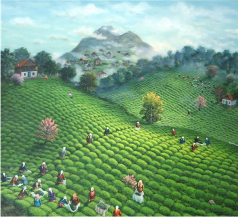
Resim 4. Yalçın Gökçebağ, Tuval üzerine Yağlı boya, 80x100 cm.

Ressam Yalçın Gökçebağ'ın eserlerinde toprak unsurunu sıkça görmekteyiz. Sanatçının bu eserinde toprağın yeşiller bütünleşmesini etkileyici bir biçimde görmekteyiz. Eser tuval üzerine Yağlı boya tekniği ile yapılmıştır. Yeşilin tonları açıktan koyuya olarak yansımıştır. Figüratif çalışmalarını bu eserde de görmekteyiz. Tema olarak, toprakla uğraşan figüratifler olarak görülmektedir.