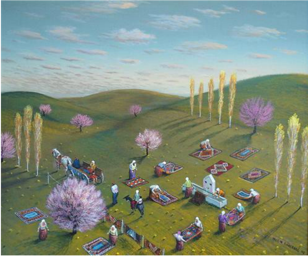
Resim 5. Yalçın Gökçebağ, Tuval üzerine Yağlı boya, 50x60 cm.

Son olarak, bu eserde yine peyzaj (manzara) türünü görmekteyiz. Eserde toprağın yeşilin birçok tonunun birleşmesini görmekteyiz. Bazı nesnelere gerçekliğin dışına çıkıp özellikle ağaçlar stilize edilerek yansıtılmıştır. Tema olarak, figüratifler tarafından yıkanan ve yayılan halı veya kilimler söz konusudur. Halı ve kilimlerin desenler oldukça gerçekçi renklerle yansıtılmıştır.