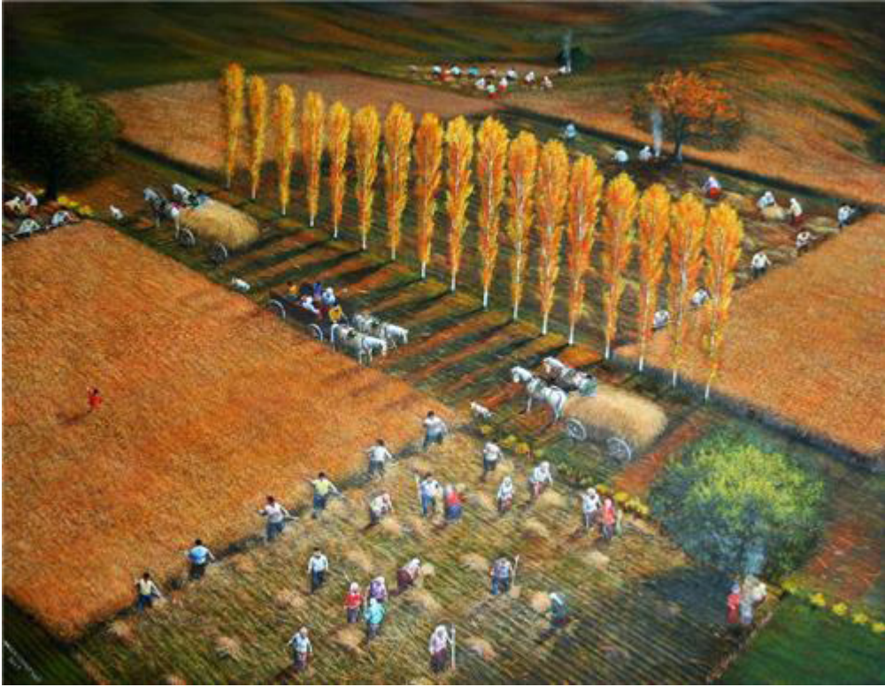
Resim 2. Yalçın Gökçebağ, Tuval üzerine Yağlı boya, 80x100 cm.

İkinci eserde, yine bir peyzaj çalışması görmekteyiz. Bu eserde birden fazla figüratif yer almaktadır Teknik olarak ise, yağlı boya ile yapılmıştır. Tema, toprakla uğraşan figüratiflerdir. Kullanılan renkler tüm gerçekçiliğini yansıtmaktadır. Toprak renklerinde farklı tonlar kullanılmıştır. Kullanılan renkler birçok farklı rengin birleşimidir.