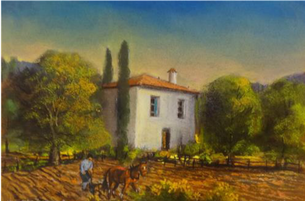
Resim 1. Yalçın Gökçebağ, Pastel, 2013, 35x50cm.

İlk eserde, Yalçın Gökçebağ'ın 2013 yılında yaptığı peyzaj çalışmasını görmekteyiz. Eserde resmin türü olan figüratifler yer almaktadır. Teknik bakımdan pastel boya ile yapılmıştır. Toprak renk olarak gerçekçiliği yansıtmıştır. Toprak unsurunda ton kullanılmıştır.